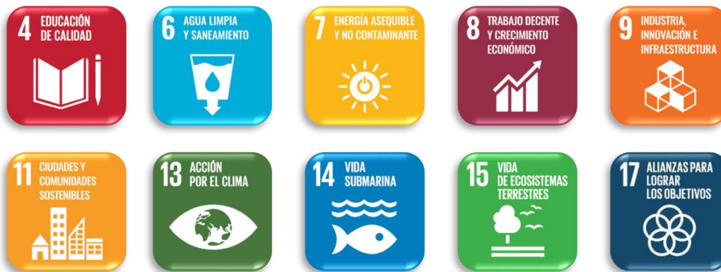
ODS relacionados con las actividades de FIHAC

FIHAC está alineada con los Objetivos de Desarrollo Sostenible (ODS) de las Naciones Unidas, cuyo objetivo es acabar con la pobreza, proteger el planeta y asegurar que todas las personas disfruten de paz y prosperidad. IHCantabria contribuye a los objetivos específicos mediante la aportación de conocimientos y know-how, y el desarrollo de iniciativas en el ámbito del agua en todo el mundo. Así, los proyectos de IHCantabria se enmarcan en diez de los diecisiete ODS: